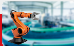
机器人预测性维护