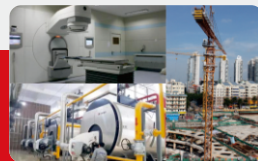
大型装备租赁监测维护