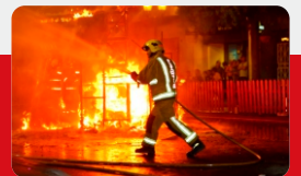
企业消防安设施监测